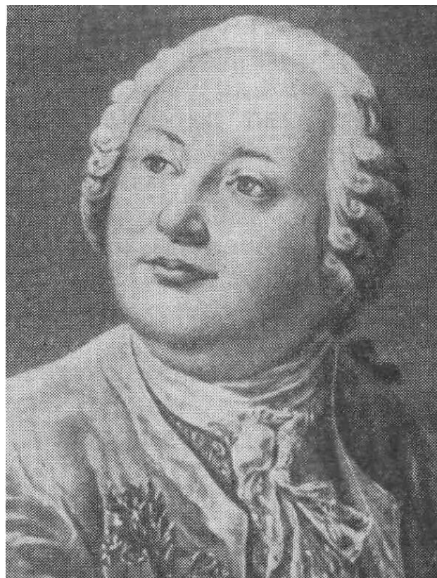
Михаил Ломоносов (1711–1765)

написал [5]: "...Не думаю, чтобы внезапным поражением нашего Рихмана натуру испытующие умы устарились и электрической силы в воздухе законы изведывать перестали".