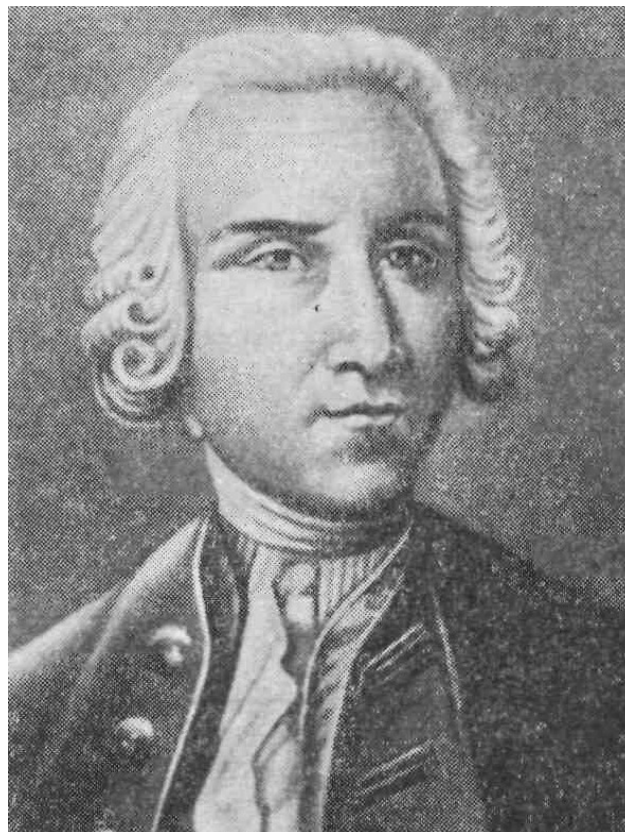
Георг Рихман (1711–1753)

Собственные опыты по электричеству он начал с 1745 года. К этому времени в мире уже накопился достаточно большой фактический материал в области электростатики: была изобретена электрофорная (электростатическая) машина, создана "лейденская банка" – первый конденсатор электричества, была известна противоположность действия положительного ("стеклянного") и отрицательного ("смоляного") электричества, установлено явление стекания электрического заряда с острия электрода.