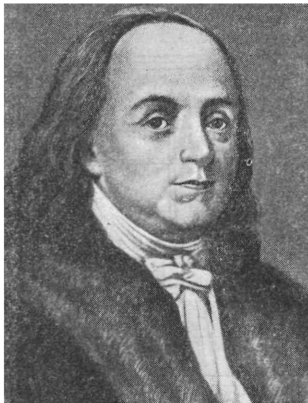
Веньямин Франклин (1706–1790)

привели В. Франклина к долгожданному успеху. Он достиг независимого финансового и обеспеченного материального положения в обществе и стал одним из уважаемых сограждан в г. Филадельфия, входившем в "новом свете" в состав молодого северо-американского государства. Научной работой В. Франклин начал заниматься в зрелом возрасте, когда ему был уже 41 год. Согласно историческим данным наукой он увлекся совершенно случайно – после того, как ему пришлось побывать на популярной лекции (сеансе "чудес физического кабинета") с демонстрационными опытами по электричеству [4]. В. Франклин заинтересовался этими опытами и активно начал самостоятельные исследования в области электричества, проявив при этом блестящий талант физика-экспериментатора. Работы по электричеству, вошедшие в анналы мировой науки, им были сделаны за весьма короткий срок – с 1747 по 1753 годы [4, 5], то есть до работ выдающихся итальянских физиков-электриков Луиджи Гальвани и Алессандро Вольты и наступления эпохи гальванического тока [2].